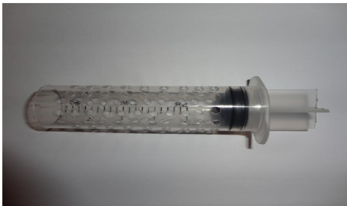
Gaiola de transporte de princesas e rainhas.

As princesas e rainhas serão transportadas, conforme figura abaixo