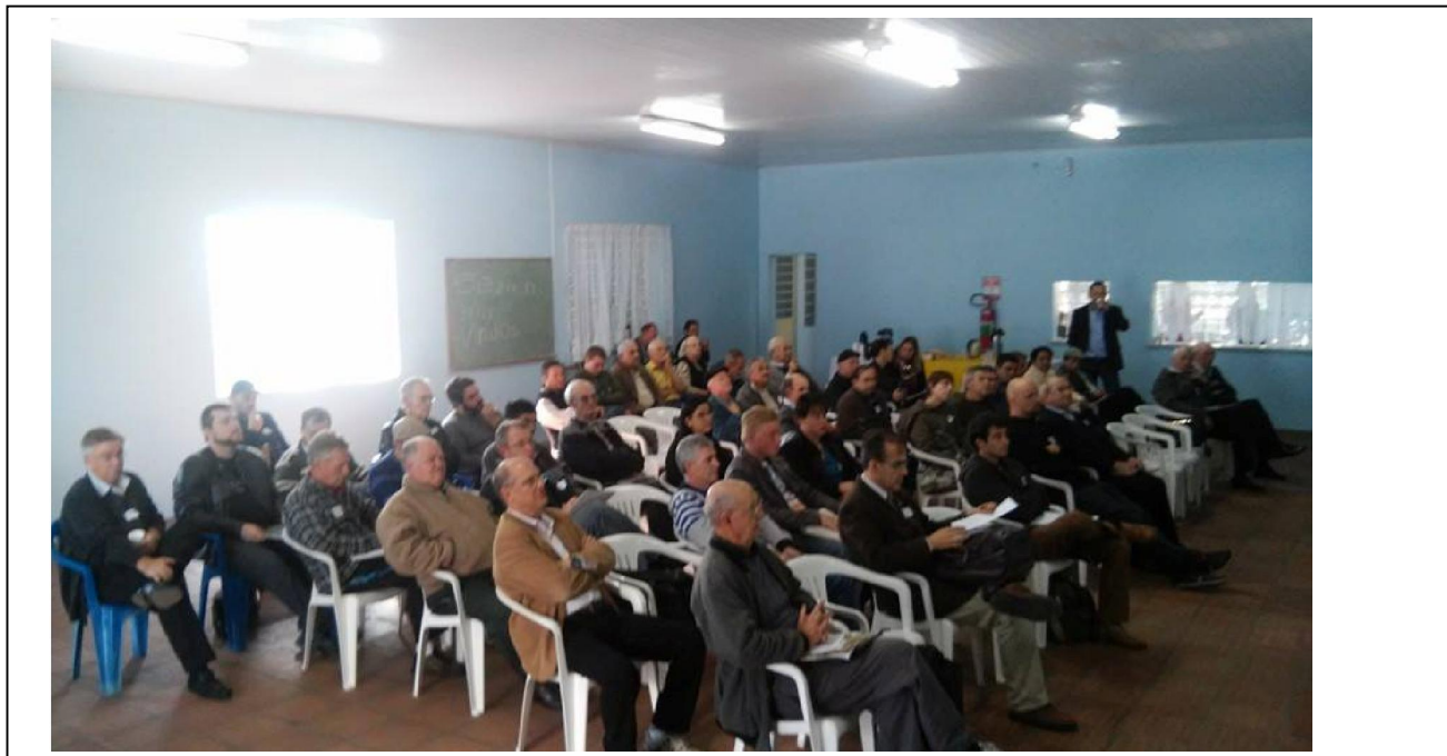
PUBLICO PRESTIGIANDO O 1º ENCONTRO REGIONAL DO VALE DOS SINOS – NOVO HAMBURGO 27-06-15